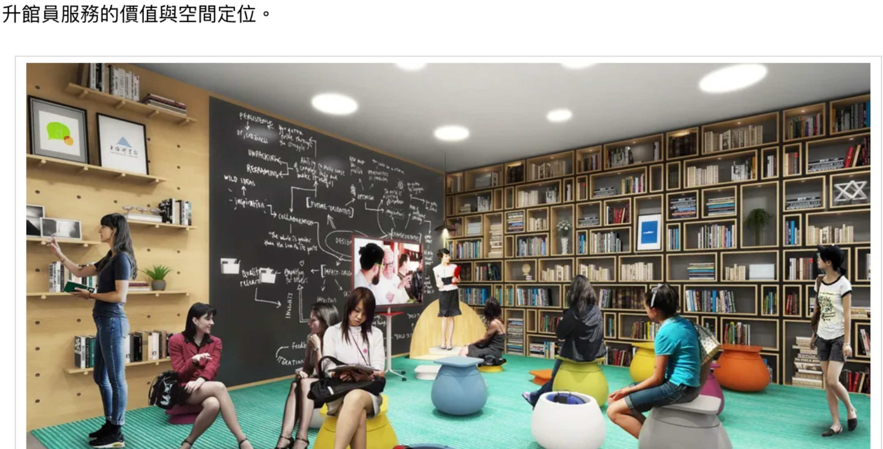
上海圖書館創·新空間完成預想圖

到這裡，放大設計範圍是一回事，更重要的是促進上圖備受策展規模化的能力。原來圖書館創·新空間的館員像房東，把房間租給房客，包含展覽、使用者。只有一個房間的時候還好，可是未來要一次放大到 100 多個房間，只做出租會無法管控品質、也無法提升創·新空間的價值，所以需要仔細一併思考如何提升館員服務的價值與空間定位。